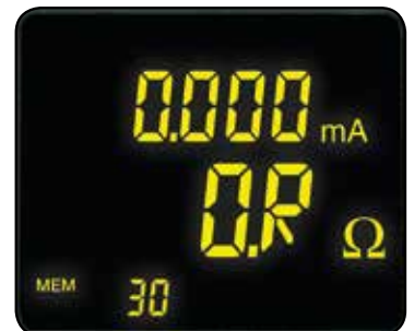
Indica que la impedancia es mayor a 1500 Ω