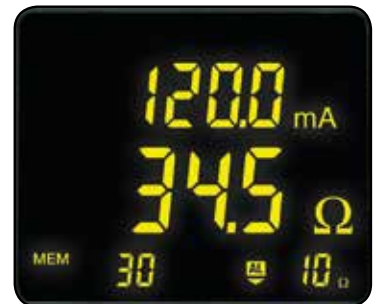
Indica el umbral de la alarma de corriente o tensión junto con la dirección de impedancia