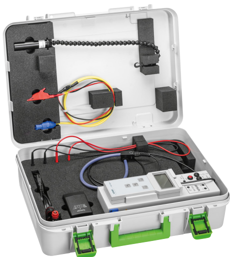
Ilustración: KSG 200 TA (con acumulador)