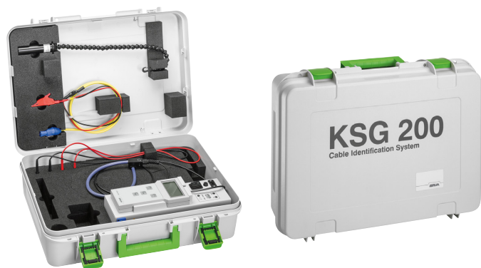
Ilustración: KSG 200 T (sin acumulador)